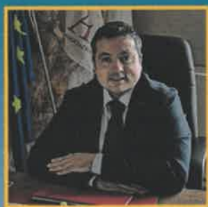
Interviene: Marcello PACIFICO Presidente nazionale